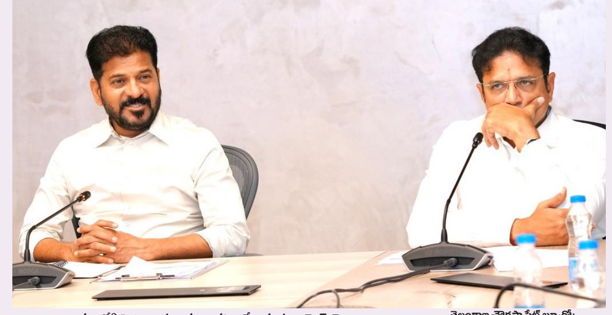
తెలంగాణ చౌరస్తా స్టేట్ బ్యూరో:

రాష్ట్రంలోకి పెట్టుబడులను ఆకర్షించేందుకు 'ఇన్వెస్ట్ తెలంగాణ' పేరుతో ప్రత్యేక వెబ్ సైట్ ఏర్పాటు చేయాలని సీఎం ఏ రేవంత్ రెడ్డి అధికారులు ఆదేశించారు. దీని కోసం ప్రత్యేక వెబ్ సైట్, లోగోను ఆకర్షణీయంగా తీర్చిదిద్దాలని చెప్పారు. ఇన్వెస్ట్ తెలంగాణ ప్రత్యేక కార్యాలయాన్ని భారత్ వ్యూచర్ సిటీలో ఏర్పాటు చేసి, దానికి గ్రూప్ 1 అధికారిని ఎస్కార్డ్ ఆఫీసర్ గా నియమించాలని సూచించారు. తమిళనాడు, గుజరాత్ రాష్ట్రాల్లోని పారిశ్రామిక విధానాన్ని అధ్యయనం చేసి, తెలంగాణ పాలసీని అంతకంటే మెరుగ్గా, ఆకర్షణీయంగా రూపొందించాలని చెప్పారు.